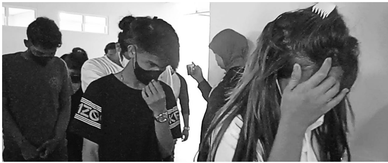
PROSTITUSI ONLINE - Sebanyak 20 orang diamankan karena terlibat dalam prostitusi online yang kemudian membuat Pemkot berang terkait penyalahgunaan perzinan tempat.

Hotel, penginapan dan jasa pijat terancam pencabutan izin jika kedapatan jadi tempat prostitusi online.