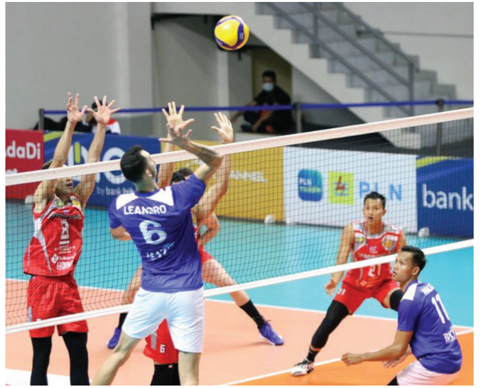
PROLIGA – Salah satu pertandingan pada Proliga 2022.