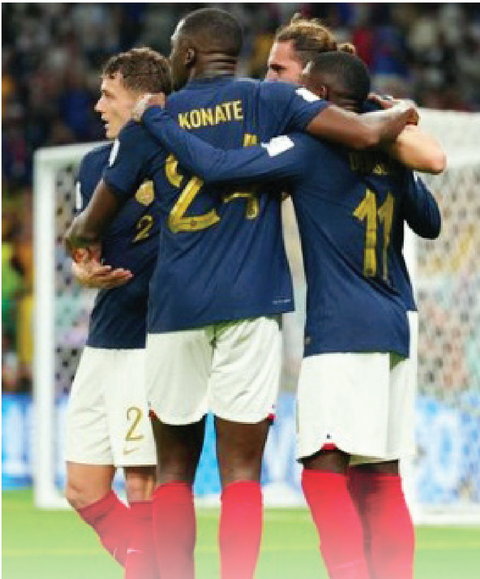
MENANG TELAK – Timnas Prancis berpesta gol ke gawang Australia 4-1 pada laga perdana Piala Dunia 2022.