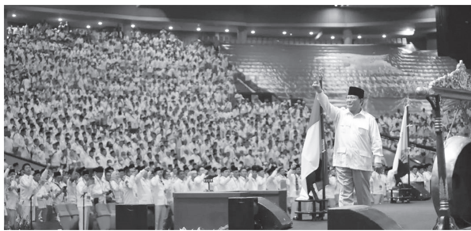
RAPIMNAS - Ketua Umum Partai Gerindra Prabowo Subianto, saat membuka Rapimnas Partai Gerindra di Sentul Internasional Convention Center (SICC), Bogor, Jawa Barat beberapa waktu lalu.

"Kami telah berkoordinasi dan mengirim bantuan beberapa saat setelah kejadian gempa. Terutama untuk korban yang berada di lokasi pengungsian seperti tenda, obat-obatan, makanan, pakaian, dan kebutuhan anak-anak. Bantuan ini tentu jauh dari mencukupi dan tidak sebanding dengan beban yang dirasakan saudara-saudara kita dalam menghadapi musibah ini," ia menjelaskan. Muzani meminta jajaran