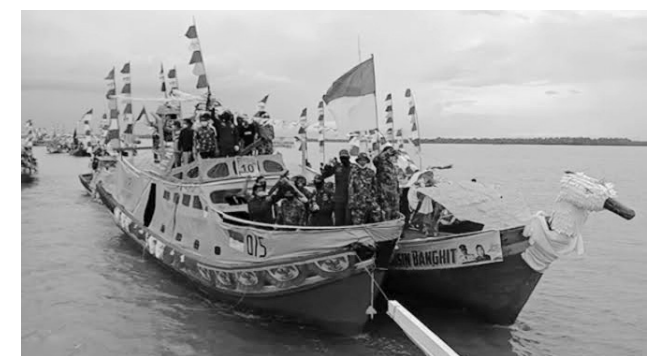
FESTIVAL KAPAL - Kecamatan Banyuasin II kembali menggelar Festival Kapal Nelayan Hias Sungsang ketiga.

"Kita tahu selama Pandemi Covid-19 ekonomi warga