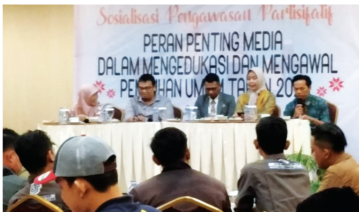
SOSIALISASI - Bawaslu kota Palembang menggelar acara 'Sosialisasi Pengawasan Partisipatif, Peran Penting Media dalam Menedukasi dan Mengawal Pemilihan Umum Tahun 2024', Selasa (22/11) di Maxone Hotel Palembang.