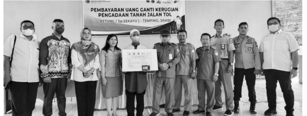
GANTI UNTUNG - Warga Desa Seratus Lapan, Sudirman, menerima uang ganti untung atas lahannya yang terkena pembangunan jalan tol.

"Seperti yang disampaikan Pj Bupati pada penyerahan ganti rugi warga di Bayung Lencir, bahwa sempat dilema untuk mempercepat proses ganti rugi. Saat itu banyak persoalan yang harus dituntaskan, terus terang kita bersama tim sempat galau. Namun, Alhamdulillah dengan segala kerja keras Tim akhirnya setelah warga Bayung Lencir secara resmi dibayarkan uang ganti untung lahannya yang