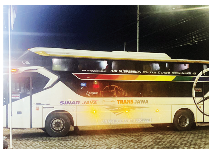
BERSIAP - Sleeper Bus bersiap membawa penumpang di pool sekaligus tempat keberangkatan Bus Sinar Jaya, Jl H Burlian KM 14 Palembang.

ADA pilihan menarik jika menggunakan moda transportasi bus yang saat ini sudah dilengkapi Sleeper seat . Terkesan mewah karena memberikan tempat duduk yang nyaman berikut fasilitas layar yang bisa menampilkan tayangan film dan musik serta tak lupa tempat pengisian baterai ponsel.