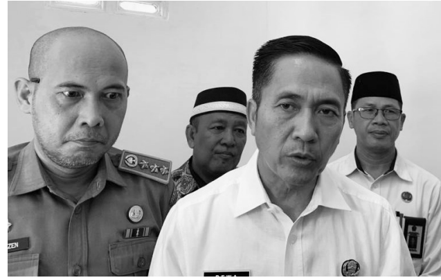
RATU DEWA-Sekretaris Daerah Kota Palembang

Ia mengungkapkan, pihaknya akan lebih memaksimalkan di tracing dan