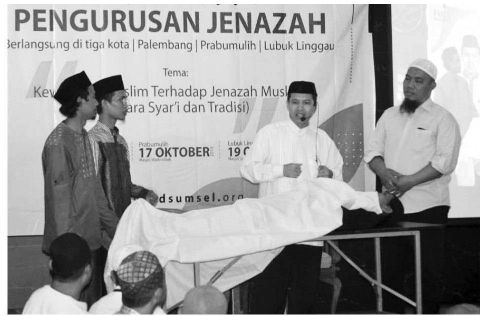
PEMULASARAN JENAZAH - Dompot Dhuafa Sumsel saat melakukan pemulasaran jenazah.

Ratusan pengurus jenazah dilatih, tak ada lagi peminjaman dari desa lain.