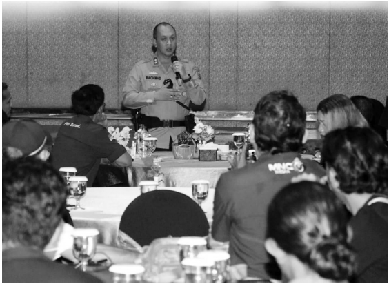
SAMBUTAN - Kapolda Sumsel, Irjen Pol A Rachmad Wibowo SIK, memberikan sambutan pada silaturahmi dengan media.