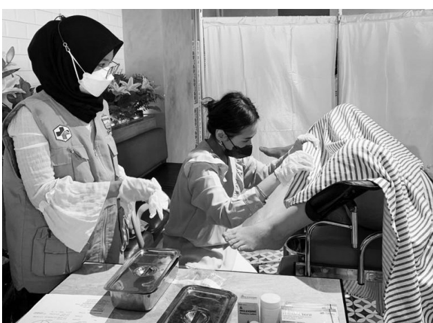
PEMERIKSAAN KESEHATAN - Salah satu warga Palembang saat menerima layanan pemeriksaan kesehatan gratis.

PALEMBANG, BP - Dinas Kesehatan Kota Palembang, Sumatera Selatan menggelar pemeriksaan kesehatan gratis di Mini Atrium Le Garden Food Gallery, Palembang Indah Mall, Rabu (23/11).