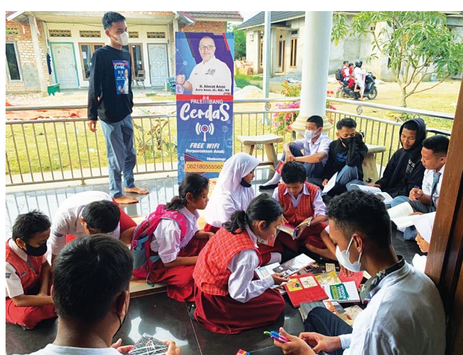
INTERNET GRATIS - Para siswa SD hingga SMU antusias mengikuti kegiatan Palembang Cerdas berupa internet gratis buku perpustakaan.

Dari kejauhan terlihat pula parkir sekitar 5 motor dengan box bertuliskan 'Palembang