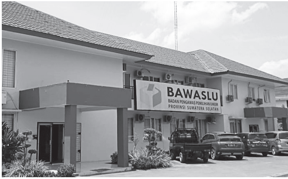
Kantor Bawaslu Sumatera Selatan.