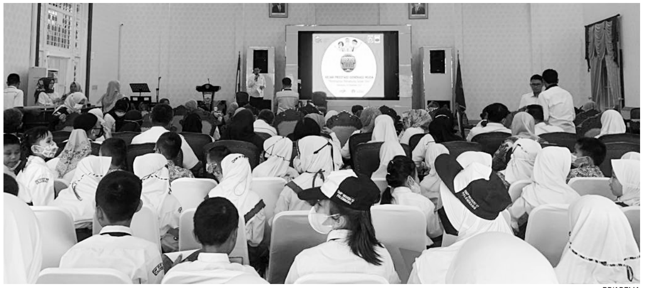
SOSIALISASI - Optimalisasi program satu rekening satu pelajar di Kota Palembang.

Penyetoran dapat dilakukan secara berkala dan rutin per pekan atau perbulan. Dimana setiap seminggu atau sebulan sekali, bank terkait akan mencatatkan setoran pelajar di