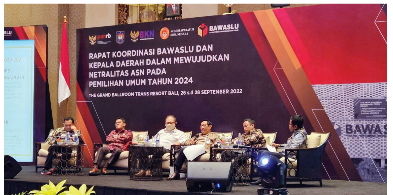
NETRALITAS - Suasana Rapat Koordinasi Bawaslu dalam mewujudkan netralitas Aparatur Sipil Negara (ASN) pada Pemilu 2024.

Kemudian penyebab kelima adalah penegakan hukum yang masih birokratis, terlalu banyak melibatkan pihak dan