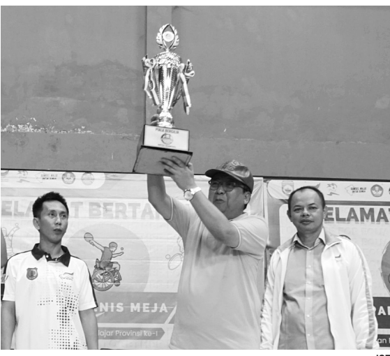
JUARA UMUM -Kontingen Muba berhasil keluar sebagai juara umum pada Paralympic Pelajar (Peparpeprov) Provinsi Sumsel, yang digelar di Jakabaring Sport City, Palembang.

Tahun 2019 tentang Hari Indonesia Menabung untuk mendorong setiap pelajar Indonesia agar memiliki rekening. #adl