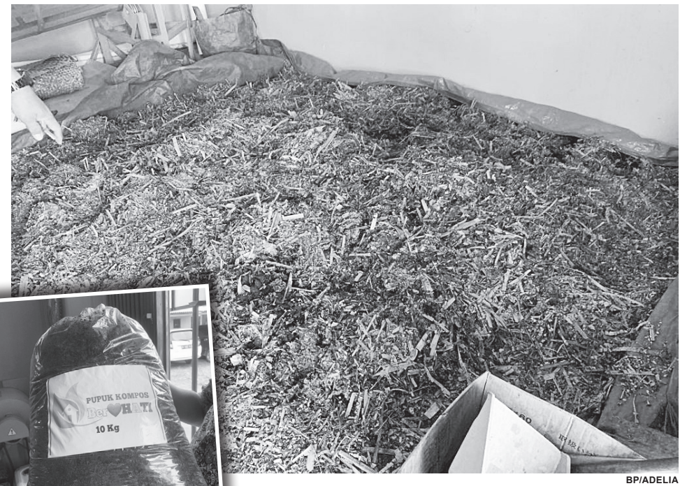
DAUN NIPAH – Limbah dari daun nipas dimanfaatkan warga Seberang Ulu 1 menjadi pupuk kompos.

Ia menyampaikan, pupuk kompos ini juga telah dilirik oleh CSR PT BA dengan membangunkan rumah kompos yang dinamakan ‘Rumah Kompos Berhati’ untuk masyarakat 3-4 ulu guna meningkatkan produksi pupuk kompos.