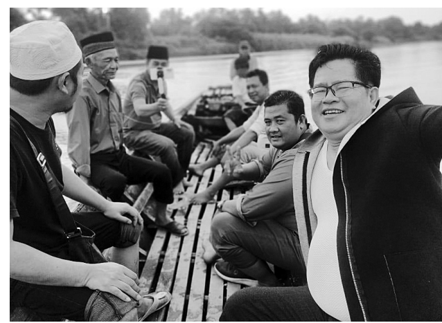
SUNGAI KOMERING - Tim Peneliti UT Palembang menelusuri Sungai Komering dengan ketek bersama tokoh Masyarakat Komering. Selasa, (20/9).

"Di awal tahun 1980-an, Sungai Komering masih ramai lalu lintas perahu dan ketek bahkan tongkang, Iliir-mudik dari ulu ke ilir dan sebaliknya. Tujuan utamanya masyarakat sini ke ilir menuju Kota Palembang. Jika dari ulu menu-