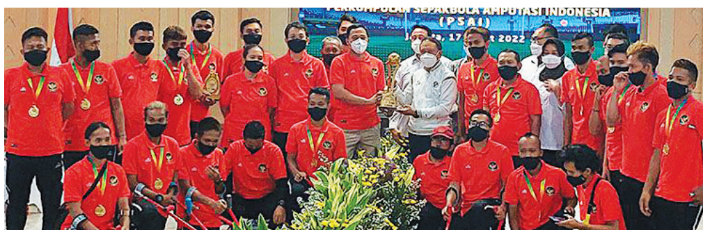
GEMILANG - Timnas Sepakbola Amputasi setelah berhasil tampil gemilang di kualifikasi Piala Dunia Sepak Bola Amputasi 2022 di zona Asia Timur.