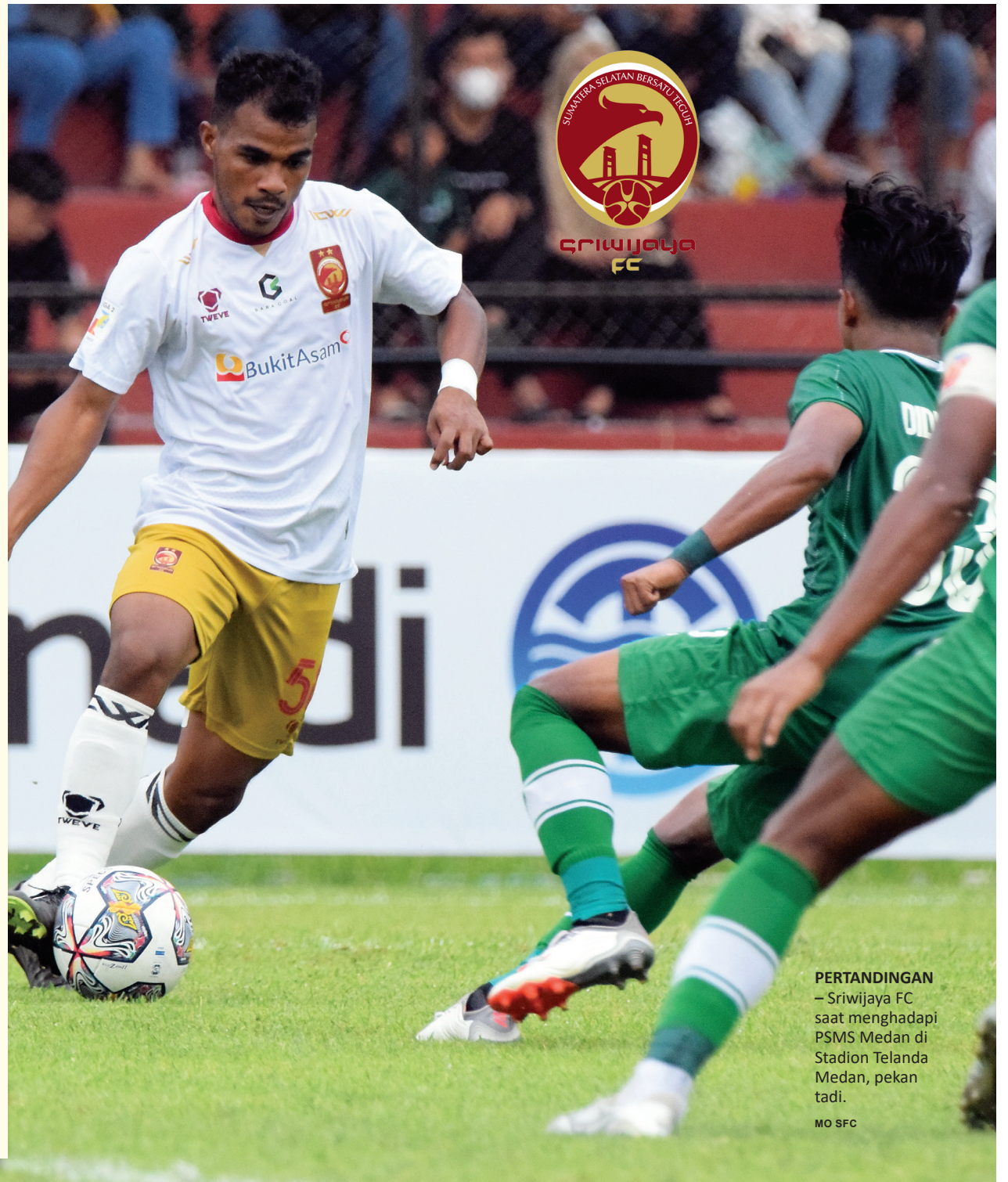
PERTANDINGAN – Sriwijaya FC saat menghadapi PSMS Medan di Stadion Telenda Medan, pekan tadi.

“Saya apresiasi dengan pemain Sriwijaya FC yang bermain Maksimal saat melawan PSMS, yang pasti kami sebagai tim lawan sudah mengantisipasi pemain pemain mana yang berbahaya. #riz