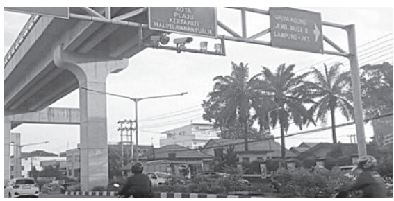
KAMERA ETLE – Salah satu titik pemasangan kamera ETLE di Kota Palembang yang sudah beroperasi sejak Maret 2022.

“Tujuan kita menggelar ini untuk memberikan pelayanan pra berakhirnya dinas kepada PNPP yang akan purna tugas,” tutupnya. #udi