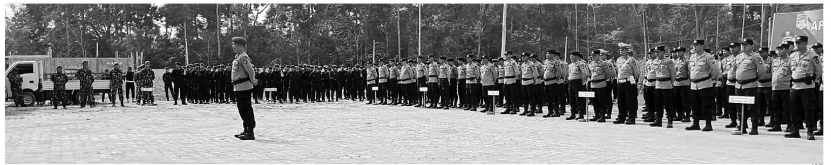
APEL - Ratusan personel Polres Mura mengikuti Apel dalam persiapan pengamanan Pilkades serentak.

"Silahkan kita laksanakan, terkait bansos diharapkan untuk dapat melakukan pendataan ulang agar program ini tepat sasaran," pungkasnya. #riz