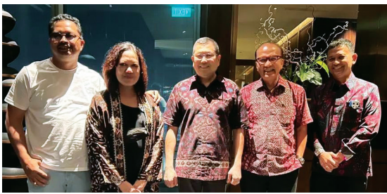
Ketua Umum DPP Partai Perindo Hary Tanoesoedibjo berfoto bersama tokoh nasional Tantowi Yahya di Kita Resto, Park Hyatt Jakarta.