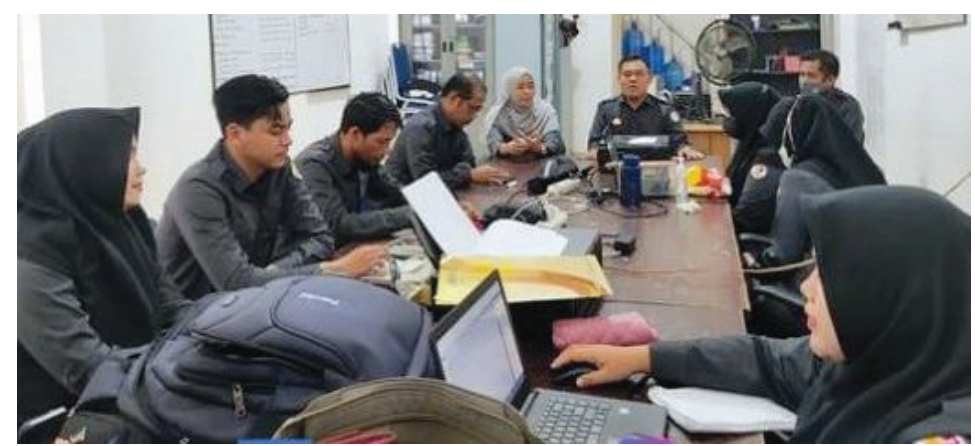
RAPAT-Jajaran pengurus Bawaslu Kota Palembang saat melakukan rapat di Kantor Bawaslu Palembang.

Pihaknya sudah melakukan tahapan sosialisasi perekrutan panwascam sejak 15 September lalu, dan pendaftaran dibuka mulai 21-27 September mendatang. Pendaftaran dapat melalui situs resmi Bawaslu kota Palembang, medsos kota Palembang baik