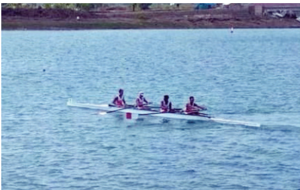
ATLET PODSI – Atlet dayung andalan Indonesia dalam beberapa event internasional.

“Memang berat karena kedua event itu digelar berurutan dan berdekatan. Tapi enggak akan ada pembagian tim karena sama-sama penting.