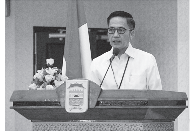
BANSOS - Sosialisasi Peraturan Walikota Nomor 24 Tahun 2022 tentang perubahan atas Peraturan Walikota Palembang Nomor 14 Tahun 2021.

“Melalui forum ini, saya berharap kiranya kita yang hadir disini dapat memanfaatkan acara ini sebaik-baiknya agar peraturan ini dapat dipahami dan diimplementasikan untuk meningkatkan kinerja di masa yang akan datang menjadi lebih baik,” tutupnya. #riz