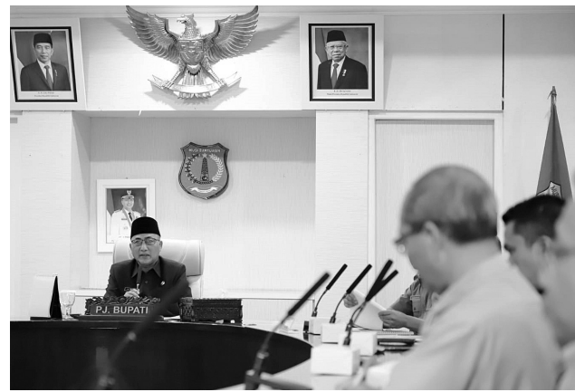
RAPAT - Pj Bupati Muba memimpin rapat membahas dampak dari kenaikan harga BBM dan persiapan untuk menekan dampak inflasi dan pemberian bantuan sosial.

rian bantuan sosial kesejahteraan keluarga, dan masyarakat berpenghasilan rendah,