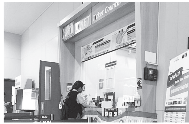
MEMBELI TIKET – Salah satu penumpang LRT sedang membeli tiket di loket yang berada di stasiun.

Kota Palembang terus bergeser menjadi smart city dengan lifestyle masyarakat perkotaan yang modern. Kenaikan harga Bahan Bakar Minyak (BBM) ikut menyumbang perubahan itu.