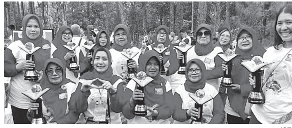
FOTO BERSAMA - Sebanyak 12 Sekolah Dasar di Muaraenim terima Penghargaan Sekolah Adiwijaya tingkat Provinsi Sumatera Selatan tahun 2022.

pasang plang tanda peringatan atau himbauan demi keselamatan warga yang melintas di Sungai Komerling ini. Kita berharap setelah selesai tidak ada lagi penumpukan eceng gondok di tiang-tiang jembatan terutama pada tiang jembatan besi yang rawan roboh apabila ada penumpukan gulma ini dalam skala besar. Untuk tahap selanjutnya akan dilaksanakan OP yaitu perawatan rutin dengan membersihkan eceng gondok yang tertampung di penahan eceng gondok ini," paparnya. #riz