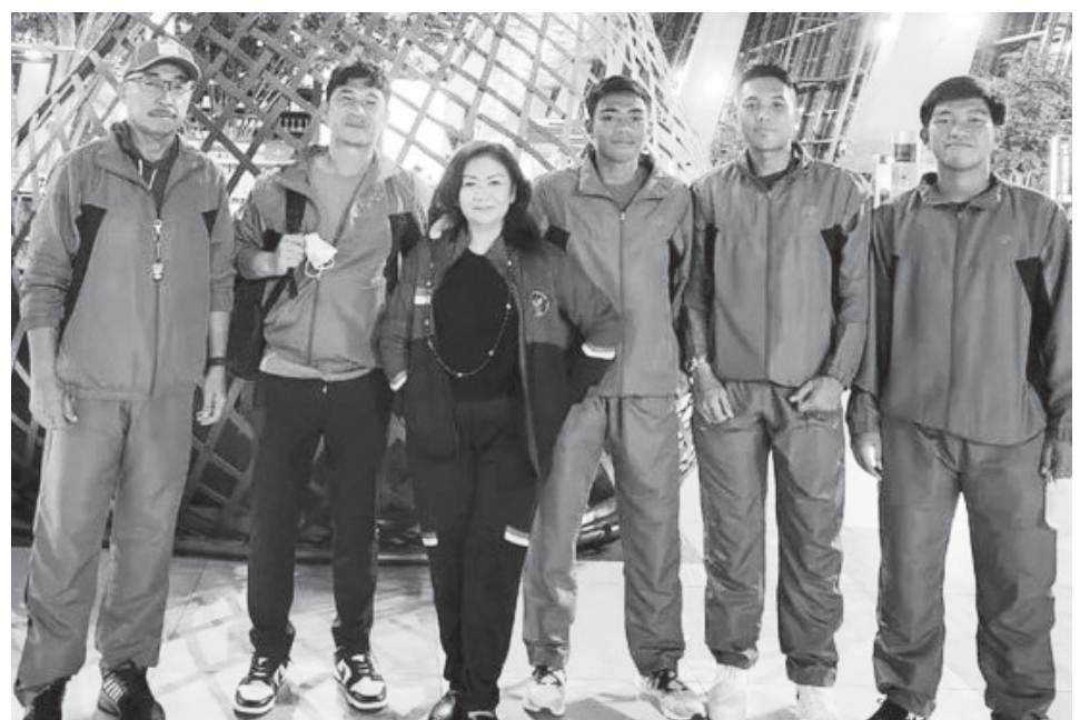
FOTO BERSAMA - Pengurus Pusat Persatuan Tennis Seluruh Indonesia (PELTI).

Pantaun di lapangan, lapangan bola yang terletak di bersebelahan dengan Kantor Camat Ilir Timur (IT) 1 ini, sejak pagi padat dipenuhi