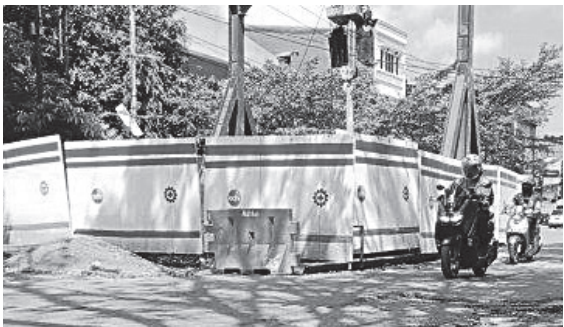
IPAL - Pengerjaan Instalasi Pengolahan Air Limbah (IPAL) Sei Selayur masih terus dilakukan.

Ini sekarang sosialisasi, masyarakat bisa tahu manfaatnya, bisa menerima tarifnya karena untuk sistem ini dapat berjalan butuh dana operasi besar. "Diperkirakan tahap awal sekitar 1.200 SR," katanya. #riz