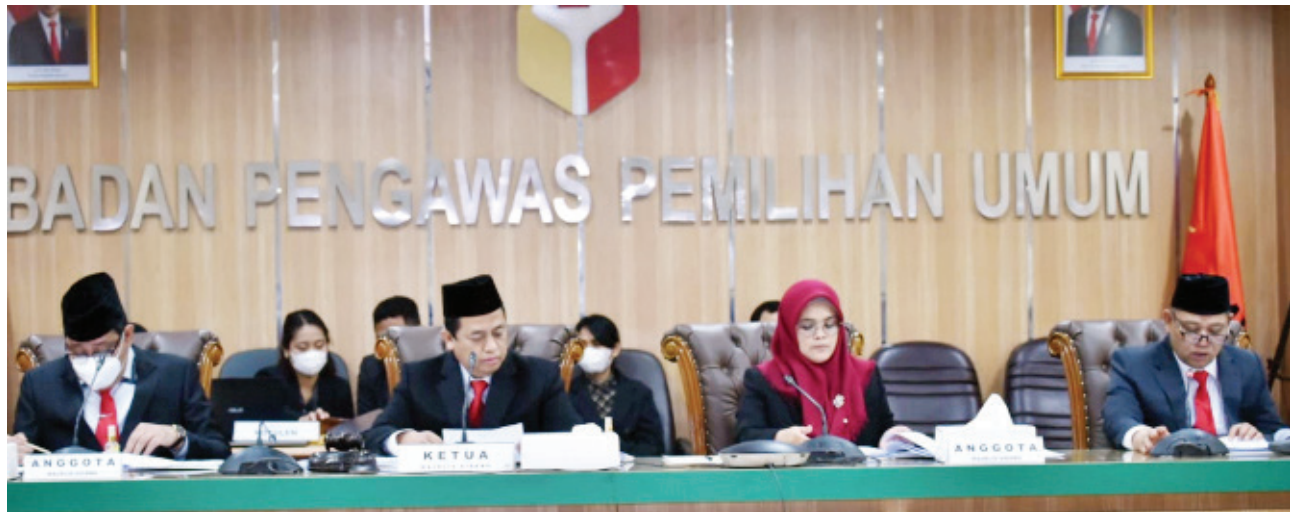
SIDANG - Majelis Sidang Bawaslu saat membacakan putusan atas laporan dugaan pelanggaran administrasi pemilu dari partai politik calon peserta Pemilu 2024 di Gedung Bawaslu.

Awalnya Bawaslu menolak dua laporan parpol Partai IBU (Partai Indonesia Bersatu) dan Partai Pelita yang melaporkan dugaan pelanggaran administrasi yang dilakukan KPU dalam sidang administrasi di Gedung Bawaslu RI, Jakarta. Terbaru Bawaslu menolak lagi laporan tujuh parpol calon peserta Pemilu 2024 mulai dari Partai Kedaulatan Rakyat, Partai Bhinneka Indonesia, Partai Pandu Bangsa, Partai Partai Negeri