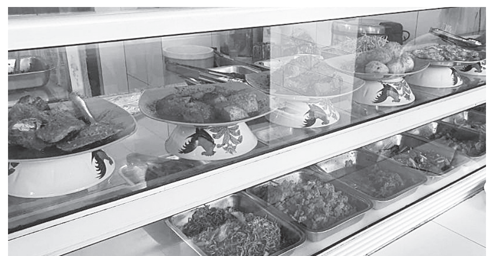
MENU MAKANAN - Warteg Bahari, Palembang, masih bertahan di harga lama pada setiap menu makanan yang dijualnya.

"Bangun sinergi dan komunikasi dengan semua pihak agar lebih inovatif," ujarnya. #adl