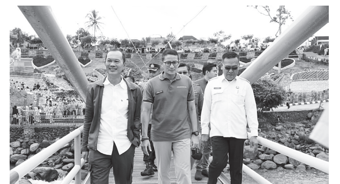
KUNJUNGAN - Menparekraf Sandiaga Salahuddin Uno, mengunjungi Agrowisata Tanjung Sakti, yang berada di Desa Sindang Panjang Kecamatan Tanjung Sakti Pumi Kabupaten Lahat, Rabu (14/9).

"Saya berharap destinasi Agrowisata Tanjung sakti bisa menumbuhkan ekonomi baru bagi warga Kabupaten Lahat. Serta bisa menjadi salah satu sektor penunjang, dalam upaya pemuliharaan ekonomi saat pandemi Covid-19," tegasnya.