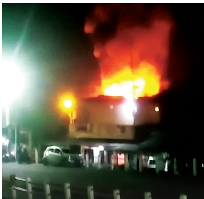
HANGUSKAN --Kobaran api menghancurkan sebuah rumah di Jalan Aiptu Wahab, Lorong Sukadamai I, Kelurahan Tuang Kentang, Kecamatan Jakabaring Palembang.