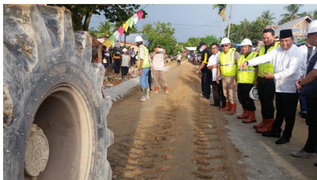
SAKSIKAN - Dodi Reza Alex Noerdin saat menyaksikan penggunaan aspal Teknologi Serbuk Karet Alam Teraktivasi di Kecamatan Banyuasin beberapa waktu lalu.

Penilaian terhadap Kepala Daerah yang menerima penghargaan tersebut didasari atas tiga kriteria yaitu kategori kerja sama pemerintah dengan badan usaha (KPBU), kategori mengubah sampah jadi energi "waste to energy (WTE)", dan kategori inovasi penerapan teknologi penyelenggaraan pembangunan infrastruktur PUPR. ▶