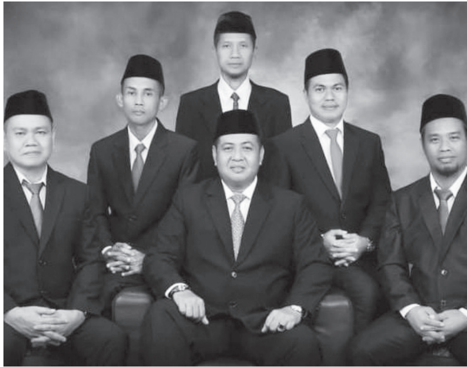
Badan Pengawas Pemilu (Bawaslu) Kabupaten Ogan Komering Ilir (OKI), Provinsi Sumatera Selatan (Sumsel).

Adapun persyaratan lainnya adalah pada saat pendaftaran berusia paling rendah dua puluh lima tahun. Tidak pernah dipidana penjara berdasarkan putusan pengadilan