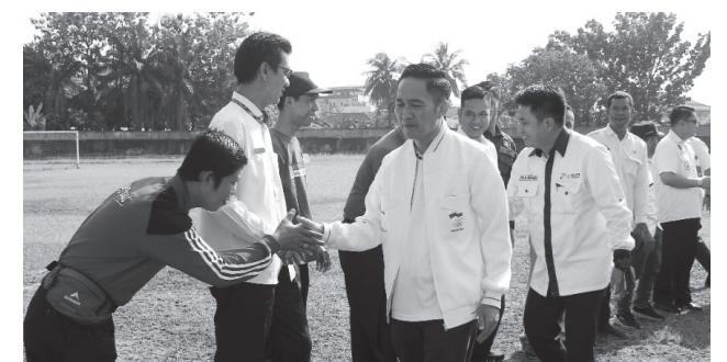
TURNAMEN U-17 - Presiden PS Palembang Ratu Dewa, yang juga menjabat Sekretaris Daerah (Sekda) Kota Palembang resmi membuka turnamen sepakbola U-17.

Putih. Indonesia sendiri sejauh ini belum pernah melewati babak pertama dan selalu harus melakoni laga play off untuk sekedar bertahan di Grup II. #Riz