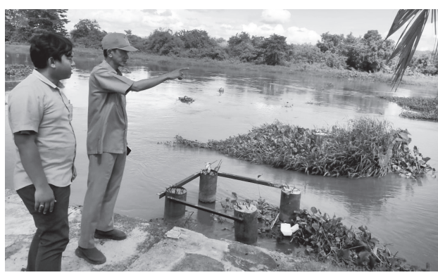
PEMBANGUNAN JEMBATAN - Lokasi pembangunan jembatan penahan eceng gondok yang berlokasi di Sungai Komerling Kelurahan Jua-Jua, di Kabupaten OKI.

"Jika pertama dilaksanakan pemancangan tiang file cap, maka pada pembangunan tahap ke dua ini tahap penyelesaian sesuai rencana ada dimana ada dua bentangan, bentang pertama. Yakni, pertama sebanyak empat unit beton file cap yang berfungsi untuk penahan utama dari eceng gondok sampah sungai. Bentang pertama ini dibangun sepanjang 56 meter atau sekitar sepertiga