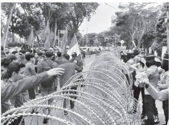
DEMONSTRASI BBM - Ikatan Mahasiswa Muhammadiyah (IMM) tertahan di gerbang DPRD Sumsel karena kandang kawat yang dipasang pihak kepolisian.

"Dengan naiknya harga BBM kami mengangap DPR RI tidak berpihak dengan rakyat. Jelas dengan kenaikan harga BBM menambah beban masyarakat saja," setelah itu massa langsung membubarkan diri. #udi