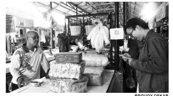
BAYAR VIA QR - Pasar Baru Talang Jambe Palembang mulai menerapkan layanan pembayaran via QR Code.

bowo mendapatkan dukungan dari PA 212. Prabowo sendiri telah mendeklarasikan diri siap maju di Pilpres 2024 pada 12 Agustus 2022 lalu. Prabowo pernah tiga kali ikut Pilpres namun kalah, akhirnya usai pemilu, Prabowo masuk dalam jajaran kabinet Joko Widodo sebagai Menteri Pertahanan. #gus