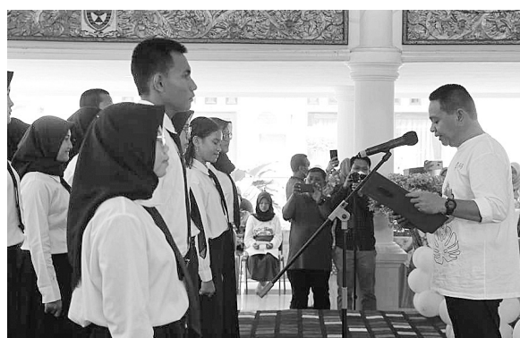
PENGAMBILAN SUMPAAH – Puluhan pelajar resmi dipercaya masuk dalam kepengurusan Forum Anak Serasan Sekundang (FASS) periode 2022-2024.

“Aksi galang dana ini bertujuan untuk membantu saudara kita yang tertimpa musibah, kita mohon dukungannya,” ujarnya. #riz