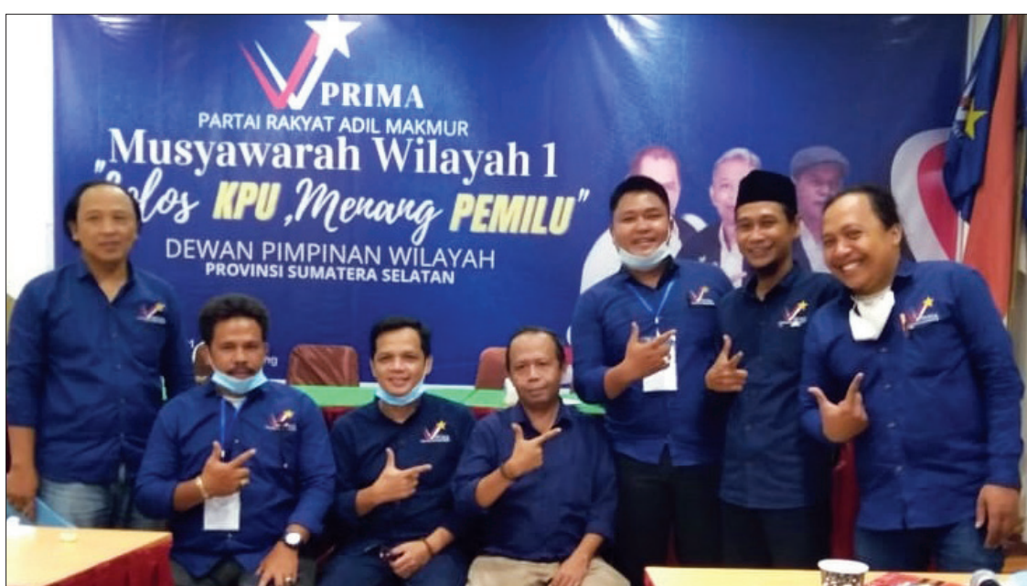
MUSWIL - Musyawarah Wilayah (Muswil) I PRIMA Sumsel bertema 'Lolos KPU Menang Pemilu' di Hotel Majestic akhir 2021 lalu.

Partai PRIMA ingin melakukan perubahan ekonomi sosial untuk Rakyat Indonesia, serta membangun kekuatan melawan kekuasaan oligarki. Partai PRIMA sebagai partai rakyat biasa programnya harus Pro Rakyat biasa. #gus