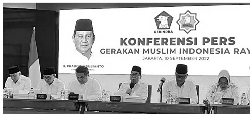
KONPERS - Organisasi sayap Partai Gerindra, Gerakan Muslim Indonesia Raya (Gemira) saat melakukan konferensi pers (konpers) di Kantor DPP Partai Gerindra.

Selain itu, terkait muncul nama Sandiaga Uno yang muncul sebagai capres dari