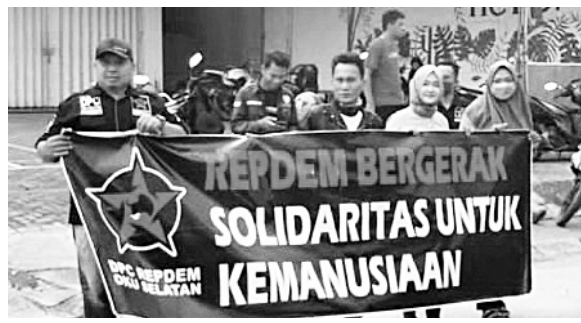
PENGALANGAN DANA -Dewan Pimpinan Cabang Relawan Perjuangan Demokrasi (DPC Repdem) melakukan penggalangan dana untuk korban kebakaran di Jalan Kecamatan Banding Agung.

Subhi ditahun 2021 menjadi Camat Inovasi Terbaik III se Sumsel. #riz