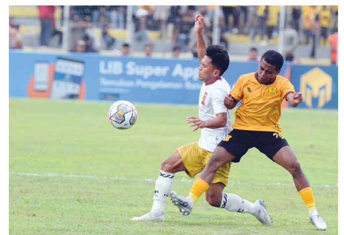
PERTANDINGAN - Sriwijaya FC berhasil menahan imbang PSDS Deli Serdang dengan skor 0-0 pada laga lanjutan Liga 2.