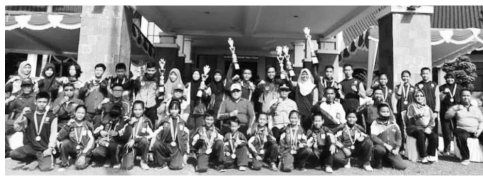
FOTO BERSAMA – Atlet dan Pelatih serta insan olahraga foto bersama saat peringatan HAORNAS di Kabupaten OKI.

“Mari kita jadikan olahraga sebagai pondasi utama untuk meningkatkan pola hidup sehat bugar bagi seluruh penduduk Indonesia,” pungkasnya. #riz