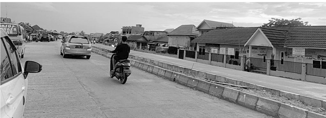
DIBUKA KEMBALI - Jalan Penghubung Jembatan Musi VI ke Kertapati telah dibuka, Minggu (11/9).

PALEMBANG, BP - Jalan baru yang menghubungkan Jembatan Musi VI menuju Jalan KH Wahid Hasyim, Kertapati Palembang yang sebelumnya ditutup kini telah dibuka kembali.