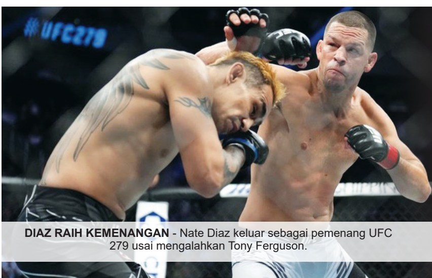
DIAZ RAIH KEMENANGAN - Nate Diaz keluar sebagai pemenang UFC 279 usai mengalahkan Tony Ferguson.

Kemudian, Irene Aldana bisa mengatasi Macy Chiasson, dan Johnny Walker menumbangkan Ion Cutelaba di kelas berat ringan. #riz