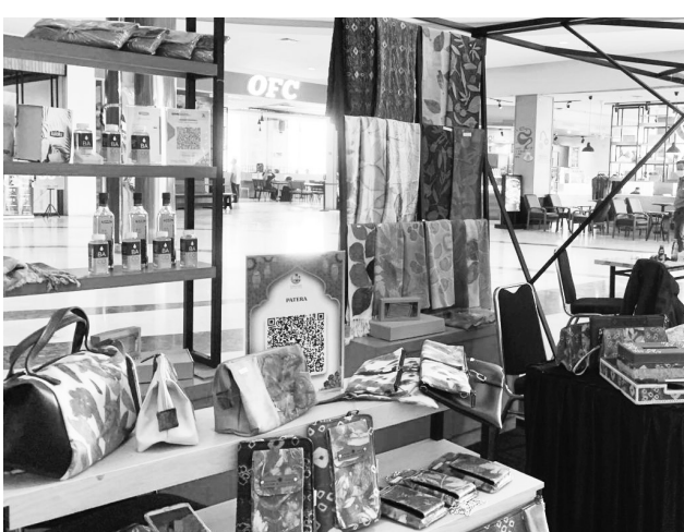
GALERI WONG KITO - Beberapa produk seperti kain, tas, dompet, yang dijual di Galeri Wong Kito.