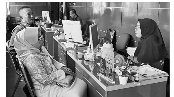
EDUKASI - Pelayanan Pusat Satu Pintu (PTSP) Madrasah Aliyah Negeri 1 Palembang (Mansapa) sedang melakukan edukasi dengan wali murid siswa di ruang PTSP, Sabtu (10/9).

Banyak keuntungan yang didapatkan dengan penerapan transaksi non tunai ini. Bagi pedagang di antaranya dapat mencegah kekurangan kembalian dan bagi pembeli dapat mengurangi resiko kecopetan saat berbelanja. #udi