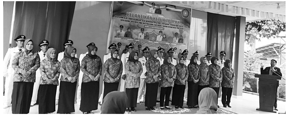
PELANTIKAN – Pelantikan 13 Ketua TP PKK di 13 desa di Kecamatan Tebing Tinggi Empat Lawang.

Sementara itu, beberapa Kades yang terpilih siap menyukseskan program sedekah yang digagas oleh Camat Tebing Tinggi, yang sebelumnya berinovasi dengan