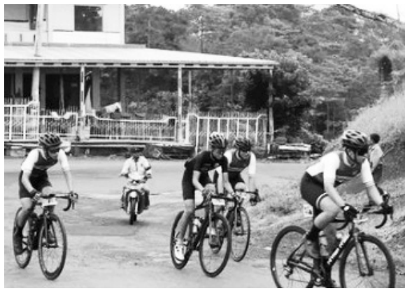
BALAP SEPEDA - Puluhan pembalap sepeda event Mandiri Dempo King Of Mountain (KOM) Challenge 2022.

"Yakin saja, bismillah, pemerintah daerah dalam hal ini saya Pj Bupati dan seluruh yang ada ini akan mencari solusi terbaik untuk Politeknik Sekayu. Tapi memang permasalahannya ada 2 wilayah satu wilayah Yayasan, dan Pemerintah Daerah Kami minta yang wilayah yayasan sudah beres, kami Pemkab Muba siap," ungkapnya. #riz