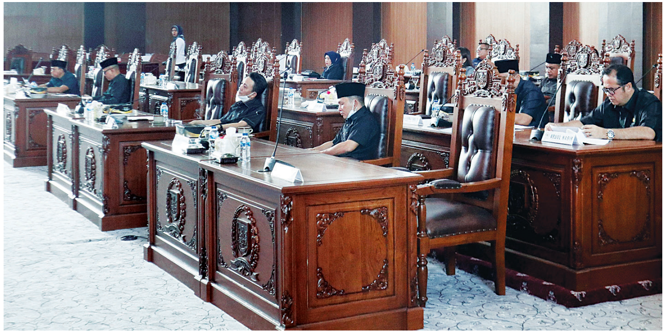
RAPAT - Para anggota DPRD Kota Lubuklinggau saat melakukan rapat di ruang rapat paripurna DPRD Kota Lubuklinggau.

"Nanti akan dilakukan penataan sekaligus penetapan dapil, baru setelah ditetapkan, partai politik bisa mengisi untuk pencalonan caleg (ca-