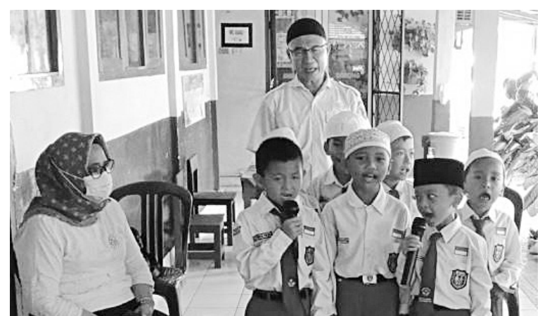
PENGAJIAN - Siswa Sekolah Dasar Negeri 1 Kayuagung, tengah mengikuti pengajaran di sekolah.

kan, seperti diketahui, keimanan dan ketakwaan merupakan hal penting yang perlu ditanamkan sejak dini, terhadap para siswa dan siswi, sehingga akan