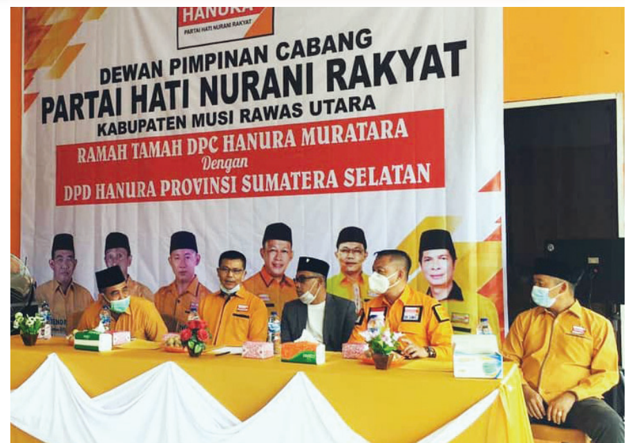
SILATURAHMI - Suasana silaturahmi dan ramah tamah DPC Hanura Muratara dengan DPD Hanura Provinsi Sumsel di Muara Rupit Muratara.

Pasalnya, rakyat sudah dilukai perbuatan mantan koruptor, apalagi jika sudah dihukum pengadilan. Maka jika kembali dicalonkan siapa yang bisa menjamin mantan koruptor tidak melakukan hal serupa jika