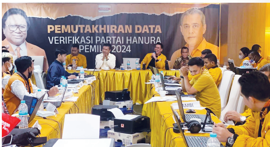
VERIFIKASI - Suasana kegiatan pemutakhiran data verifikasi partai Hanura pemilu 2024, DPD Hanura sumsel beberapa waktu lalu.

Ketua DPD Partai Hanura Sumatera Selatan