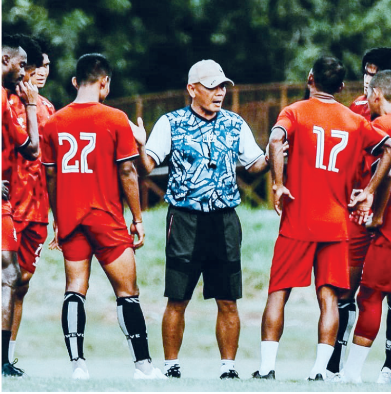
Sriwijaya FC vs Semen Padang FC Stadion Atletik JSC, Palembang Senin (5/9) kick off pukul 15.30 WIB