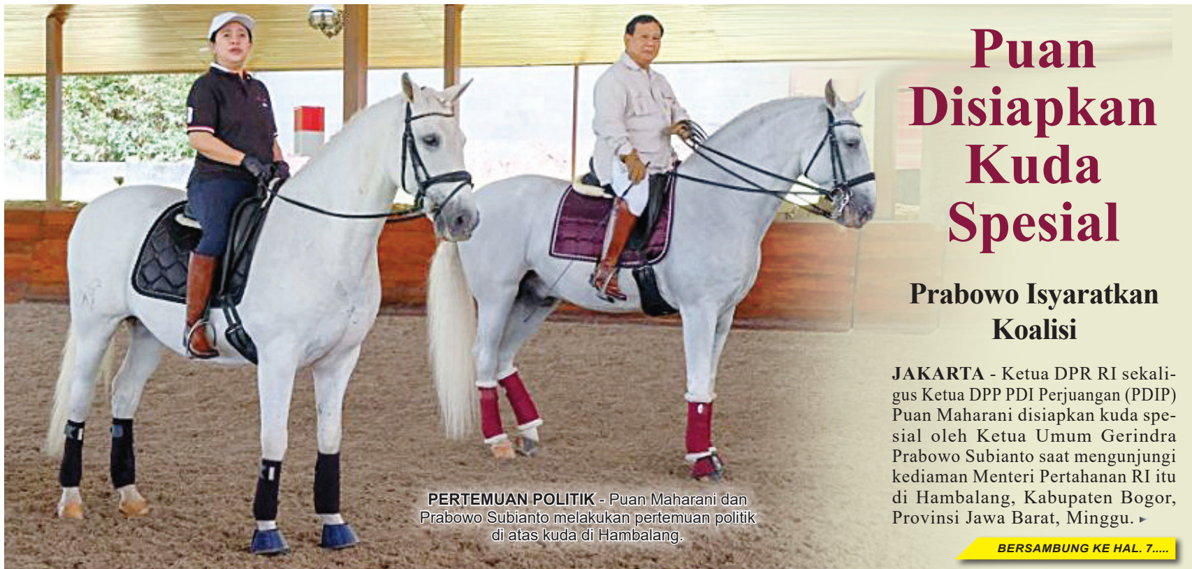
PERTEMUAN POLITIK - Puan Maharani dan Prabowo Subianto melakukan pertemuan politik di atas kuda di Hambalang.