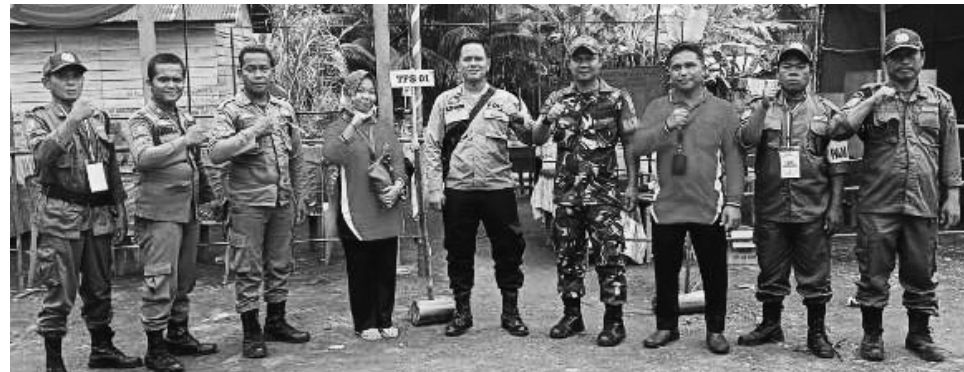
FOTO BERSAMA - Pemilihan Anggota Badan Permusyawaratan Desa (BPD) Sukajaya, Kecamatan Gelumbang.

leksi yang diikuti agar beasiswa tepat sasaran," tandasnya. #riz