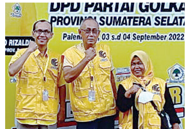
RAKORDA - Para pengurus DPD Partai Golkar Ogan Ilir dalam rakorda MPO se Sumsel pada tanggal 3-4 September 2022, di DPD Partai Golkar Sumsel.

MPO ini sebagai salah satu instrumen partai Golkar yang dituntut kreatif dan maksimal memanfaatkan media guna menarik simpati masyarakat. "Salah satunya dengan sosialisasi melalui billboard bergambar Ketua Umum DPP Partai