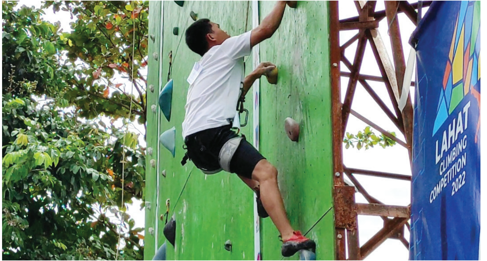
PANJAT TEBING – Salah satu atlet yang turun di Lahat Climbing Competition 2022.