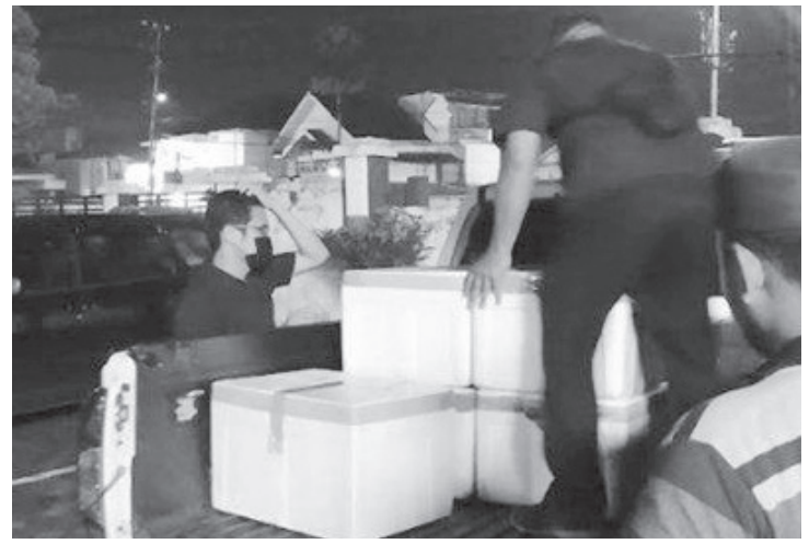
PENYELUNDUPAN – Sebanyak 15 box Styrofoam berisi 71.150 benih lobster berhasil diamankan di gerbang Tol Keramasan, Sabtu (30/7) sekitar pukul 16:40. IST

“Kami sudah minta keterangan kepada tersangka, dan dia bilang kalau ini mau dikirim ke luar negeri lewat Pelabuhan Tanjung Api-api. Dia hanya mengantar saja. Selanjutnya pelaku kami serahkan ke Polda Sumsel untuk pemeriksaan,” katanya.