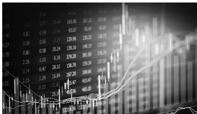
INVESTASI - Ilustrasi grafik masyarakat mulai meleak dengan investasi.

Meningkatnya jumlah investor tersebut berbanding lurus dengan nilai transaksi Sumsel di pasar modal, yang mana tercatat Rp57 triliun per Juni 2022 atau telah mencapai separuh dari nilai transaksi 2021. Namun, perlu digarisbawahi bahwa mayoritas masih didominasi dari Kota Palembang yakni mencapai Rp52 triliun. Lantaran itu, KBEI akan lebih mengencangkan sosialisasi terkait pasar modal ke warga yang berada di kabupaten/kota. #riz