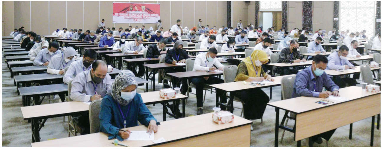
TES - Para peserta Calon Anggota Bawaslu Provinsi Sumatera Selatan saat menjalani tes psikologi, di Ballroom Golden Sriwijaya Buildings Palembang beberapa waktu lalu.

Menurutnya, Bawaslu RI akan melakukan fit and pro-