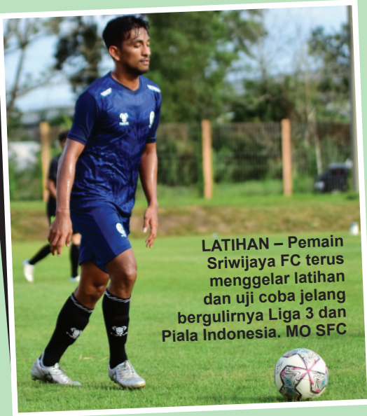
LATIHAN – Pemain Sriwijaya FC terus menggelar latihan dan uji coba jelang bergulirnya Liga 3 dan Piala Indonesia. MO SFC

“Mohon doanya supaya target dari Sriwijaya FC bisa tercapai,” ucapnya. #riz