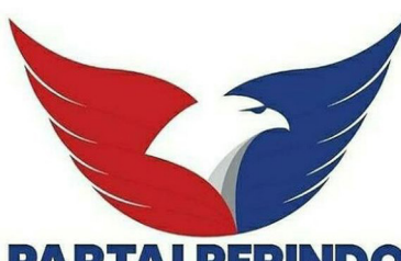
PARTAI PERINDO PERSATUAN INDONESIA

JAKARTA, BP - Sekretaris Jenderal DPP PDIP Perjuangan, Hasto Kriyianto, menyatakan, partai politiknya