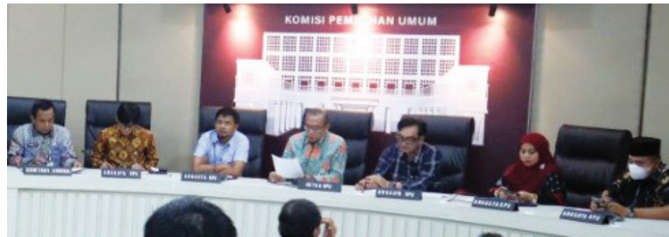
DAFTAR - Jajaran KPU RI saat menyampaikan jadwal pendaftaran partai politik calon peserta Pemilu 2024.

JAKARTA, BP - Sebanyak 10 partai politik (parpol) dijadwalkan mendaftarkan diri sebagai calon peserta Pemilu 2024, ke Komisi Pemilihan Umum (KPU) RI pada hari ini Senin (1/8).