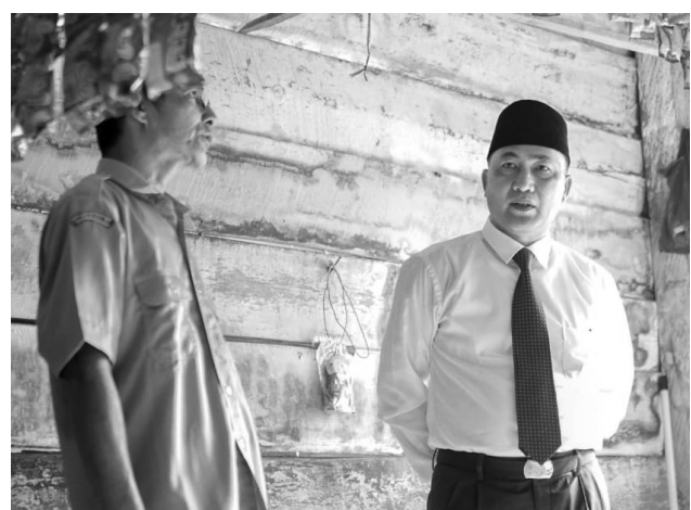
RUMAH RUSAK - Kondisi rumah penjaga sekolah SD Negeri Sungai Batang Sekayu-Plakat Tinggi mulai alami kerusakan sehingga diminta diperbaiki oleh Pj Bupati Muba Apriyadi, Selasa (19/7).

"Terima kasih pak Bupati Apriyadi, akhirnya kami bisa tinggal di rumah yang layak huni," tandasnya. #riz