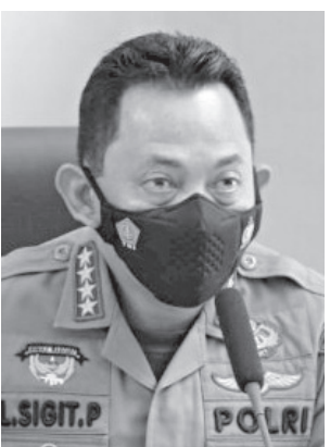
Kapolri Listyo Sigit

KAPOLRI Jenderal Pol Listyo Sigit Prabowo mengatakan pihaknya tidak antikritik dan membuka ruang seluasnya bagi masyarakat untuk menyampaikan pendapat atau kritiknya agar institusi tersebut menjadi lebih baik.