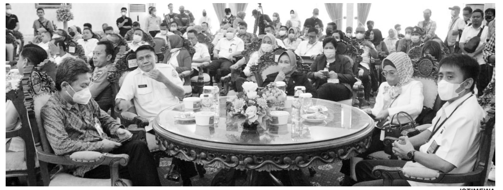
LAUNCHING - Dinas Pariwisata Kota Palembang melakukan launching Palembang 360 di rumah Dinas Walikota Palembang, Sabtu (20/7).

Sementara itu, Koordinator Media Digital Kemendikbud, Firnandi Gufron mengun-