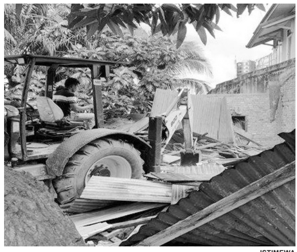
BANGUNAN DIROBOKKAN - Dikawal puluhan petugas kepolisian, alat berat meratakan dua bangunan rumah, Senin (18/7).

Tersangka Fera mengaku baru sekali ikut melakukan aksi pencurian motor diajak kekasihnya Virgo. Kelima tersangka akan dikenakan pasal 362 KUHP dengan ancaman kurungan penjara 7 tahun. #udi