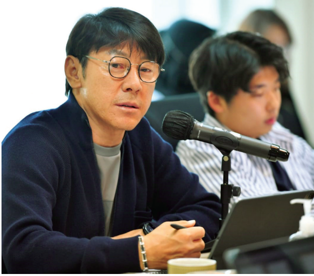
Pelatih Timnas Indonesia Shin Tae-yong.

Pelatih Shin Tae-yong berikan 'raport' pada Timnas U-19 dan beberkan program latihan kedepan.