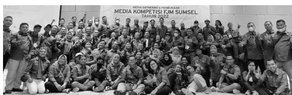
FOTO BERSAMA - Media Gathering dan Pembukaan Media Kompetisi Forum Jurnalis Migas (FJM) Sumatera Selatan (Sumsel) di Hotel Golden Tulip, Bandar Lampung, Selasa (19/7).

"Sekarang juga telah terjadi transformasi digital dimana bisnis media arus utama sedang tidak baik-baik saja. Namun, jangan pula membenturkan media sosial