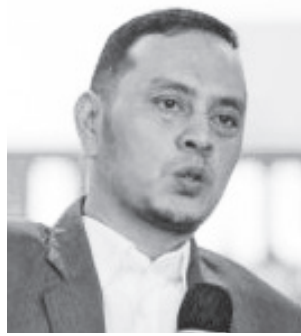
Willy Aditya Anggota DPR RI

Di sisi lain, kita juga masih dalam masa pemulihan pasca-pandemi. Seperti kita rasakan bersama, dampak pandemi covid-19 tidak hanya menyerang aspek kesehatan, tetapi juga aspek sosial dan ekonomi. Baik