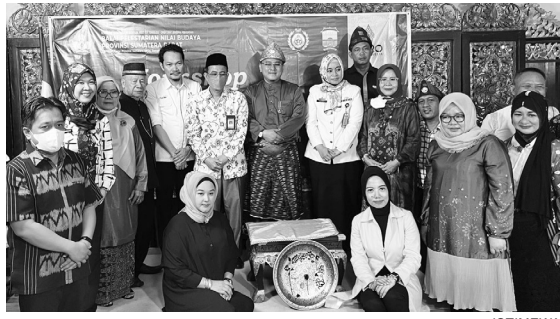
LAQUER - Sultan Mahmud Badaruddin (SMB) IV Jaya Wikrama RM Fauwaz Diradja, SH., M.Kn mengapresiasi upaya pengenalan kembali kriya laquer kepada generasi muda.

dari keterpurukan pariwisata melalui media digitalisasi, serta dapat mendukung sektor kemajuan pariwisata," pungkasnya. #gus/riz