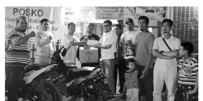
Penyerahan bantuan kebakaran dari DPC PKS Kaldoni ke Posko PKS IT 2.

Untuk diketahui, kebakaran terjadi di kawasan Batu Ampar