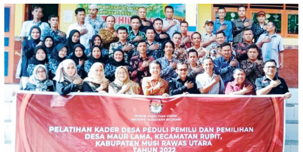
PESERTA - Para peserta pelatihan kader desa peduli pemilu Desa Maur Lama Kecamatan Rupit Kabupaten Muratara.

"Setelah pelatihan kader desa peduli pemilu juga akan ada program kelas demokrasi, jika kader desa peduli pemilu menyadari ke desa-desa, untuk sekolah demokrasi nanti untuk masyarakat umum dari berbagai kalangan bisa ikut," kata dia. #gus